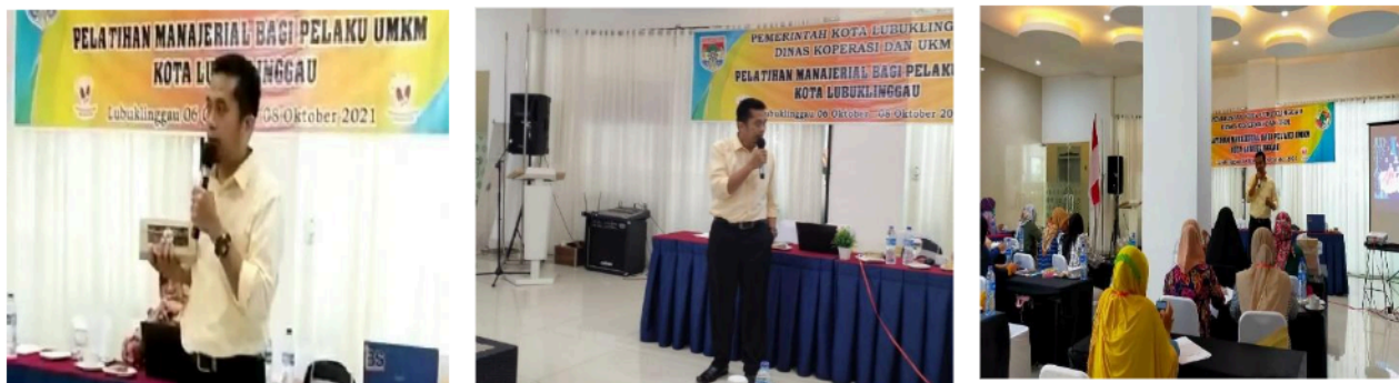
Gambar 1. Proses Pelatihan Manajerial bagi pelaku UMKM Kota Lubuklinggau

Selain pengaturan dan penggunaan keuangan secara tepat, Skill pada pembuatan laporan keuangan merupakan salah satu indikator pada kemampuan manajerial untuk mengelola keuangan secara baik. Keberhasilan dari pelaksanaan program pengabdian kepada masyarakat ini terlihat dari respon positif yang diberikan peserta pada kegiatan pelatihan ini, peserta sangat semangat dan antusias selama mengikuti pelatihan manajerial bagi UMKM produktif di Kota Lubuklinggau.